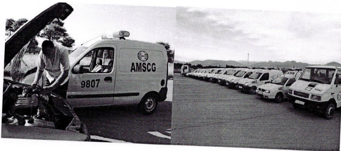
Prilog 1. Jedan dio vozila SPI za prevoz vozila kao i dio patrolnih vozila

Iako AMSCG pokriva cjelokupnu teritoriju Crne Gore u poslovima SPI, takodje će biti nastavljeno sa širenjem mreže SPI baza, te sezonsko instaliranja baza u sredinama gdje je povećan priliv motorizovanih građana tokom ljetnje ili zimske sezone.