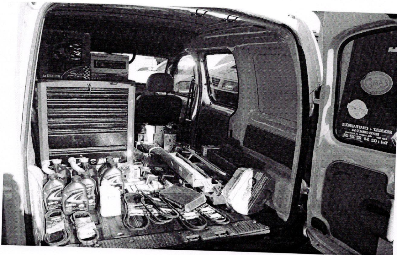
Prilog 2. Unutrašnji izgled vozila za pomoć na putu